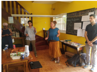
La directrice de la régie, à gauche de l'animatrice du pôle culturel, et à droite l'animateur du Gal Nord qui accompagne les bénéficiaires tout au long de leur projet

Le 8 mars dernier s'est tenue au GAL Nord Centre la première série de visites de projets ayant reçu sur la programmation 2014-2022 un financement LEADER. Trois bénéficiaires ont été rencontrés tout au long de la journée par les élus et techniciens des collectivités présentes sur le territoire du GAL, par le Conseil départemental, co-financeur systématique de ces projets, et par des membres du comité de programmation du GAL.