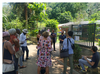
Les travaux de rénovation du gîte laissé à l'abandon ont duré plus de deux ans. Un potager en aquaponie a été installé de même que des panneaux solaires et des citernes de récupération d'eau de pluie pour s'inscrire dans une optique de préservation des ressources.

Enfin, le gîte de Mliha, en lien avec le club de plongée Happy Divers , qui sera bientôt prêt à accueillir des groupes et touristes pour partager différentes activités nautiques et terrestres, et la possibilité de 15 couchages, en dortoirs et en chambres doubles.