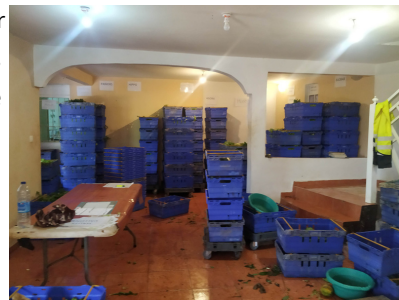
Les légumes de la COOPAC sont également disponibles en vente directe à Kawéni, magasin Kagna Maoré et à Combani en face du marché couvert toute la semaine.

Ensuite la COOPAC, coopérative du centre , installée depuis près d'un an à Tsingoni, avec une nouvelle plateforme logistique aménagée pour optimiser la conservation et la distribution des fruits et légumes de ses maraîchers, 500 t sont traitées ici par an.